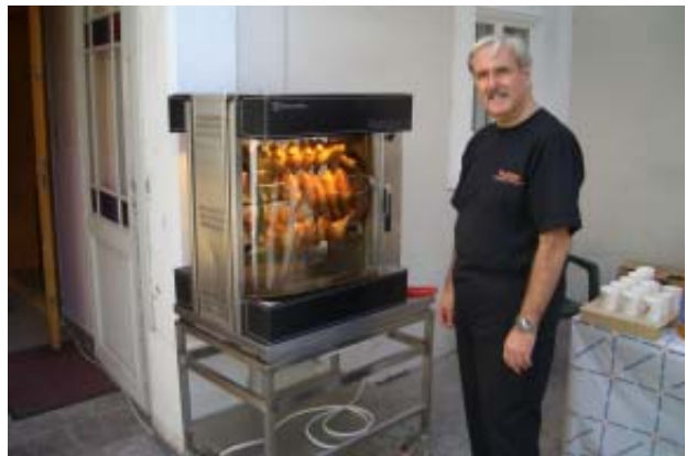
Gute Stimmung herrschte wieder am Pfarrfest, das diesmal am 2. September stattfand.