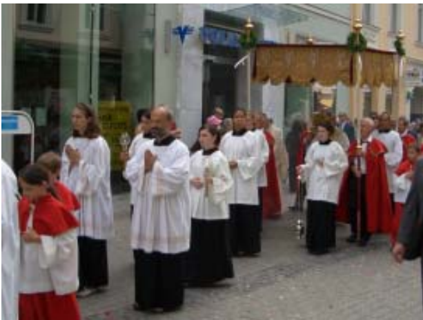
Fronleichnamsprozession am Hauptplatz

Erscheinungsort: Baden bei Wien Verlagspostamt: A-2500 Baden bei Wien Zulassungsnummer: 02Z030375