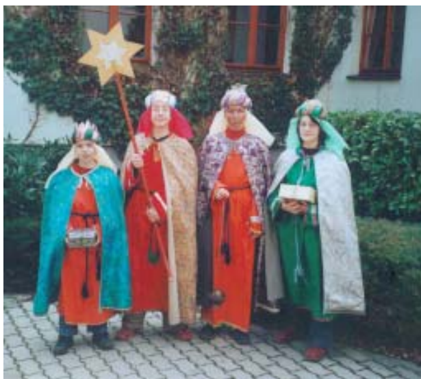
Vom 2. bis 6. Jänner waren wieder die Sternsinger in unserer Pfarre unterwegs. Danke allen Kindern und Begleitern, die ihre Freizeit in den Dienst der guten Sache gestellt haben!